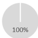
2. Afstemming op taxonomie van beleggingen exclusief overheidsobligaties*